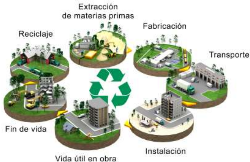
Diagrama de flujo del ciclo de vida